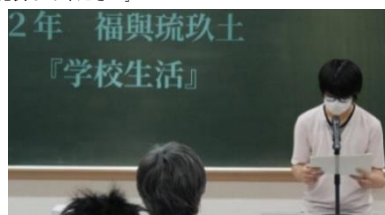
緊張感の中、発表が続きました