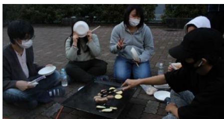
・天候にも恵まれたBBQでした