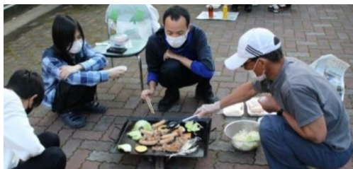
・誰が焼き担当？生徒も先生方も頑張りました