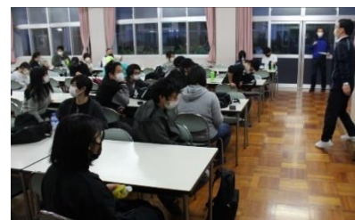
・BBQの後は体験文の原稿を書きました