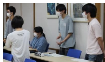
結果発表を受けた4名が起立

今年度の校内生徒生活体験発表会では、中学校の時のこと、勉強に関すること、入学した時の気持ちや現在の自分についての発表があり、4名の生徒が優秀賞に選ばれました。