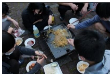
・締めは恒例の焼きそば