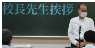
「自分の言葉で発表してください」